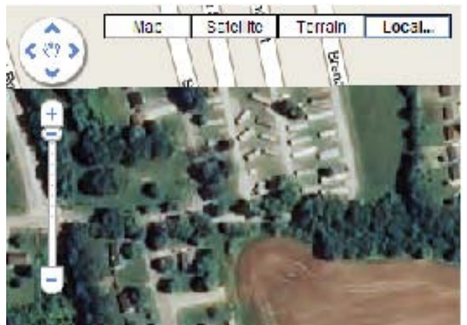
Google マップの同じタイルオーバーレイを最大ズームレベル 17 で表示したものの (この緯度では Google マップの解像度は 1m です)。