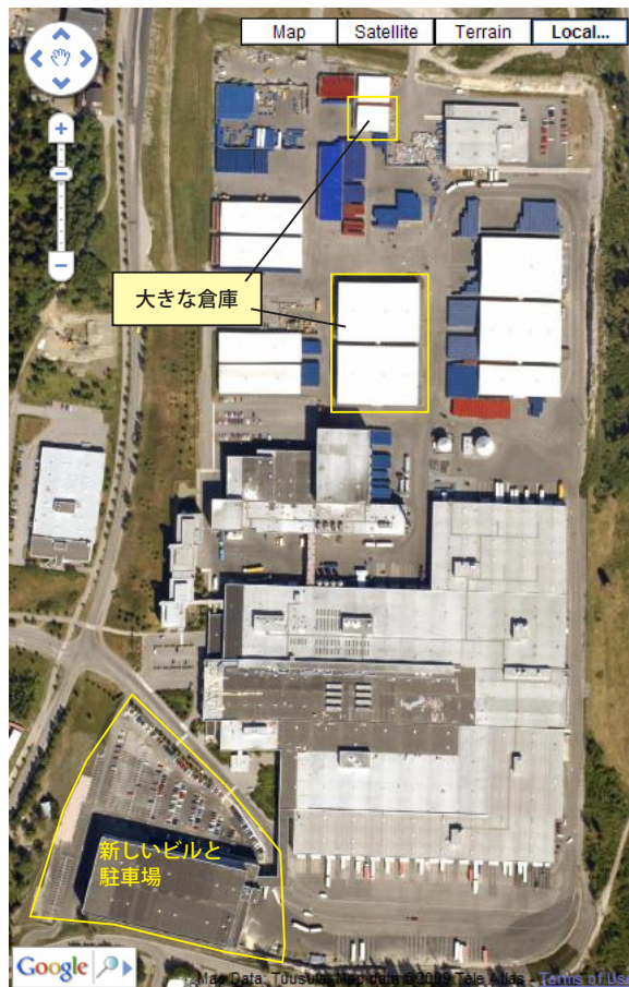
フィンランドの Kerava にある Sinebrychoff 醸造所と倉庫から成る施設の表示。(左)Google マップの古い航空写真レイヤ。(右)2006 年の正射画像より作成したローカルタイルオーバーレイ。新しいローカル画像では、南西の角に新しいビルと駐車場の敷地ができ、北の方には倉庫の建物が拡張した様子がわかります。

TNTmips の自動モザイク処理では、タイルオーバーレイに含める Google マップのズームレベルの範囲を設定することができます。各ズームレベルに対して 1 つずつタイルセットが生成されます。タイルレイヤは Google が定義し提供しているどのズームレベルに対しても構築することができます。モザイク処理は、あなたの入力画像や地図をもとに適切な Google マップのズームレベルの範囲の初期値を自動的に決定、設定します。最大ズームレベルの初期値はあなたの画像や地図の最大の精細度を得るように自動的に設定されます。その結果、ズームレベルが Google マップの解像度よりも高い解像度であれば、より高倍率に拡大したときにこれらの高解像度タイルレベルが自動的に使用されます。最小ズームレベルの初期値は、あなたのオーバーレイの画像領域が 256x256 ピクセルのタイル 1 個を超えない大きさのレベルです。最小・最大ズームレベルは、マニュアルで変更でき、1 つのズームレベルで全体をカバーするようになり、ズームレベルの範囲を好きなように変更することができます。